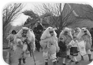
Fastnachtsumzug in Mohács