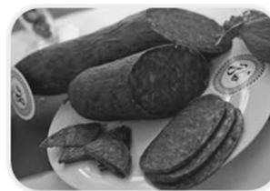
Wurstfest in Csaba/Gyula/Fonyód/ Budapest