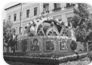
Blumenkarneval in Debrecen

Nur diese Lösungen können akzeptiert werden. Jede richtige Lösung ist 1 Punkt wert.