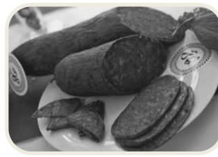
Csabai/Gyulai/Fonyódi/ Budapesti kolbászfesztivál