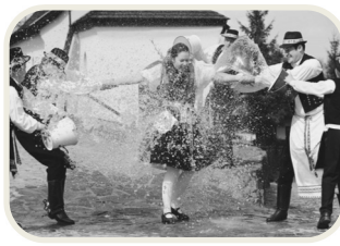
Locsolkodás / húsvét